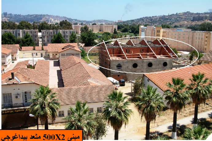
مبنى 500x2 مقعد بيداغوجي

أوصى السيد مدير الجامعة بضرورة تسريع وتيرة الأشغال بالورشات المختلفة فبالنسبة لمشروع 500 x 2 مقعد بيداغوجي و الواقعة في حدود قسم علوم الطبيعة و الحياة بالمزرعة النموذجية سابقا فقد وصلت الأشغال به إلى 50% حيث سيكون بالإمكان استلام الشطر الأول منه نهاية السنة الجارية.