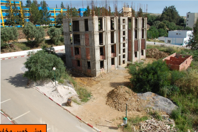
مبنى خمس مخابر

يبقى مشروع مبنى خمس مخابر بحث و التي وصلت الأشغال به إلى 80% قيد الإنجاز. في حين سجل انطلاق الأشغال بمشروع 600 مقعد بيداغوجي جديد و عن مشروع قطب الامتياز فقد وصلت الأشغال به إلى 35% .