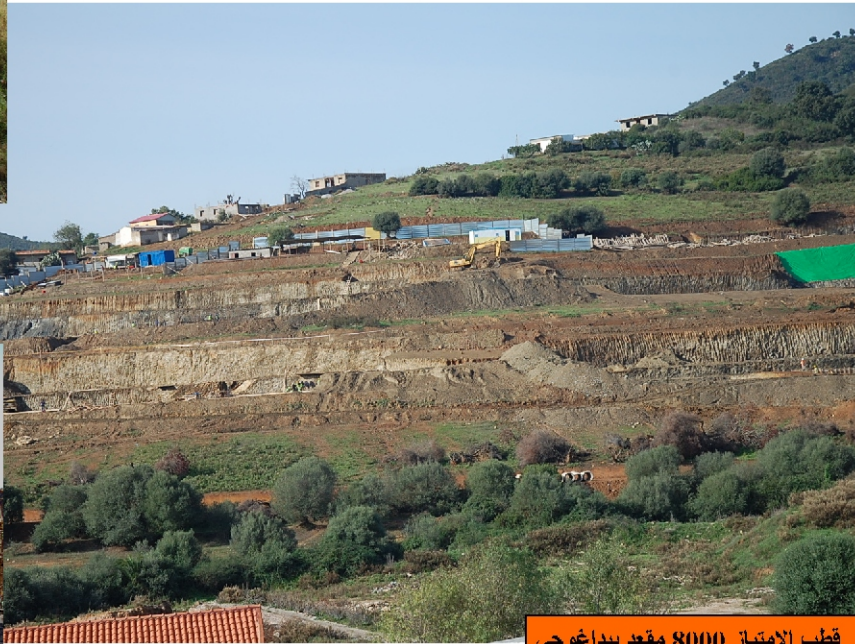
قطب الامتياز 8000 مقعد بيداغوجي