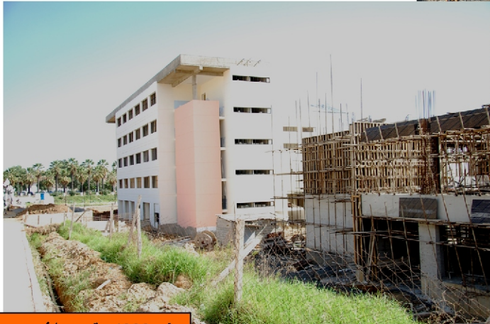
مبنى 4000 مقعد بيداغوجي